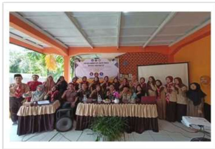
Gambar 1. Kegiatan Pengabdian Kepada Masyarakat

Setelah pelaksanaan workshop dan pendampingan berbasis praktik reflektif, terjadi peningkatan yang signifikan pada pemahaman dan keterampilan guru. Hasil angket akhir (posttest) menunjukkan rata-rata skor meningkat menjadi 84,7, dengan persentase peningkatan sebesar 22,3 poin. Selain itu, sebanyak 85% guru telah mampu menyusun modul ajar yang memuat integrasi nilai kearifan lokal secara eksplisit pada tujuan pembelajaran, materi, dan aktivitas siswa.